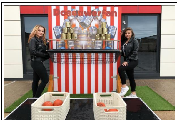
Dosenwerfen (Betreuung durch Sie möglich)