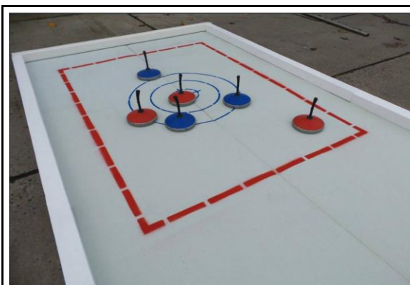
Eisstock-Funcurling (Betreuung durch Sie)