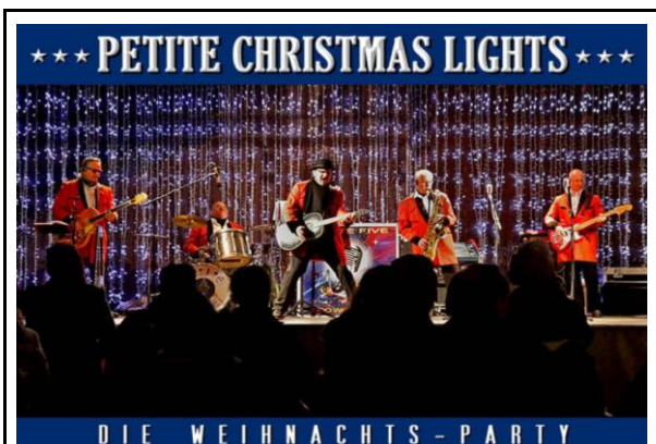
Weihnachtliche Musik mit 3 Musikern | 3 Stunden