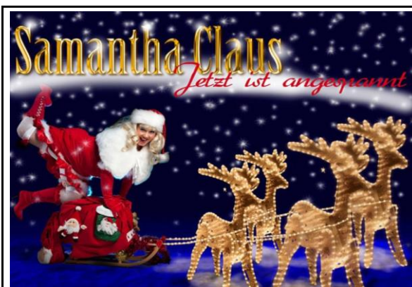
Weihnachtliche witzige Comedy