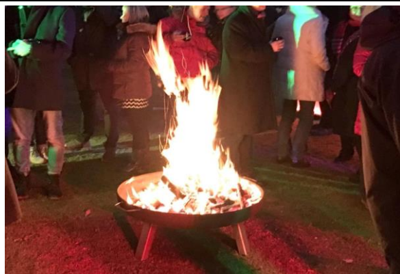
Feuerstation inkl. Brennholz + 2 Bänke sowie Marshmallows und Nürnberger Würstchen am Spieß