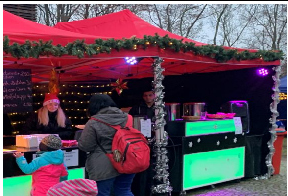
Leicht dekoriertes Weihnachts - Faltzelt