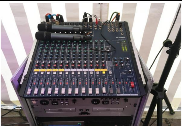
Tonanlage mit Weihnachtsmusik & Mikrophon