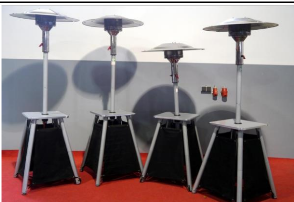
Heizpilz inklusive Gas