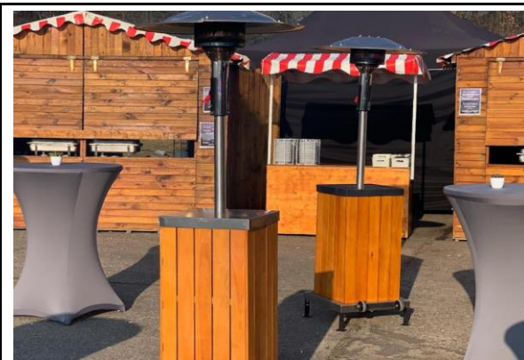
Rustikaler Heizpilz mit Gas