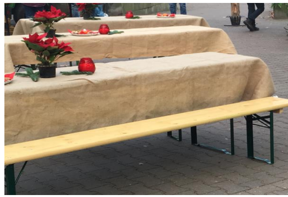
Festzeltgarnitur mit Jute Tischdecke