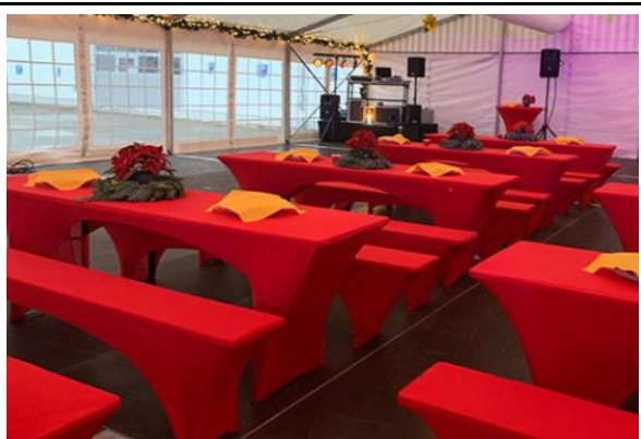
1 Festzeltgarnitur mit roter Stretchhülle