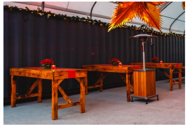
Rustikale Lange Stehtische (8 Personen)