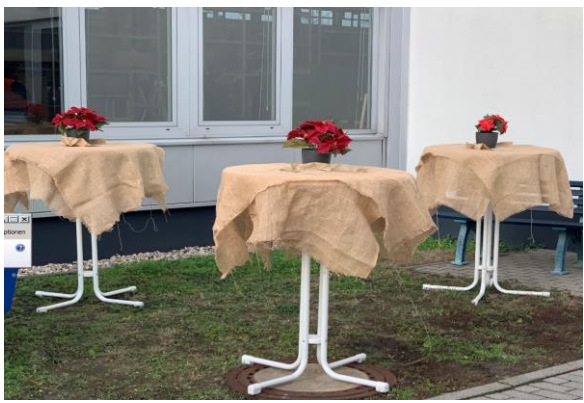
Steh Tisch mit Jute Tischdecke