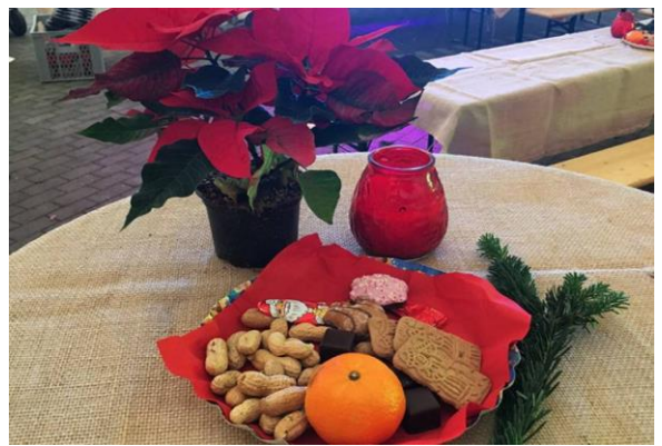
Tischdeko | bunter Teller