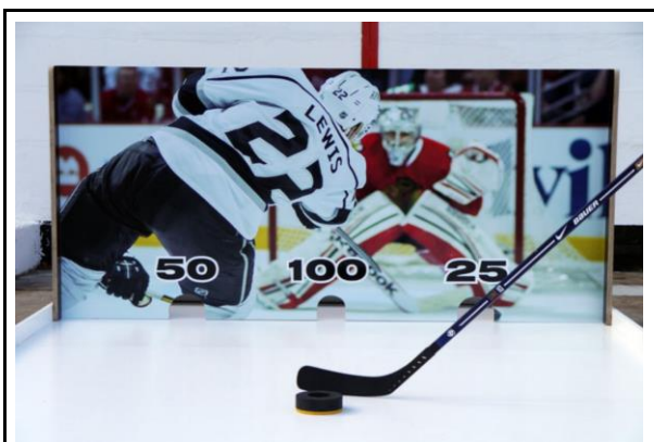
Eishockey Penaltyschießen (Betreuung durch Sie möglich)