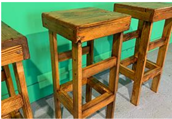
6 Barhocker für Stehtisch