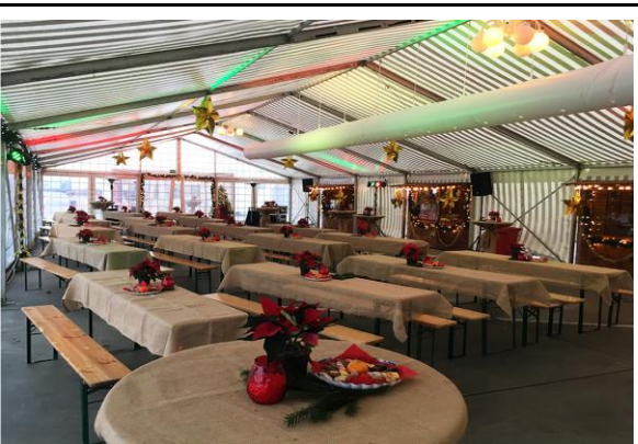
Festzelt mit Weihnachtsdekoration