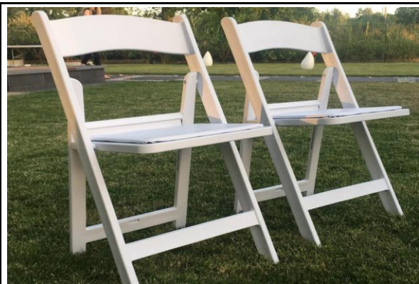
gepolsterter Festzeltgarnitur Stuhl