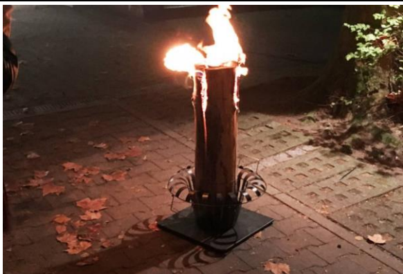
1 Feuerständer mit 1 x Schwedenfeuer

Brenndauer pro Schwedenfeuer ca. 2,5 Stunden